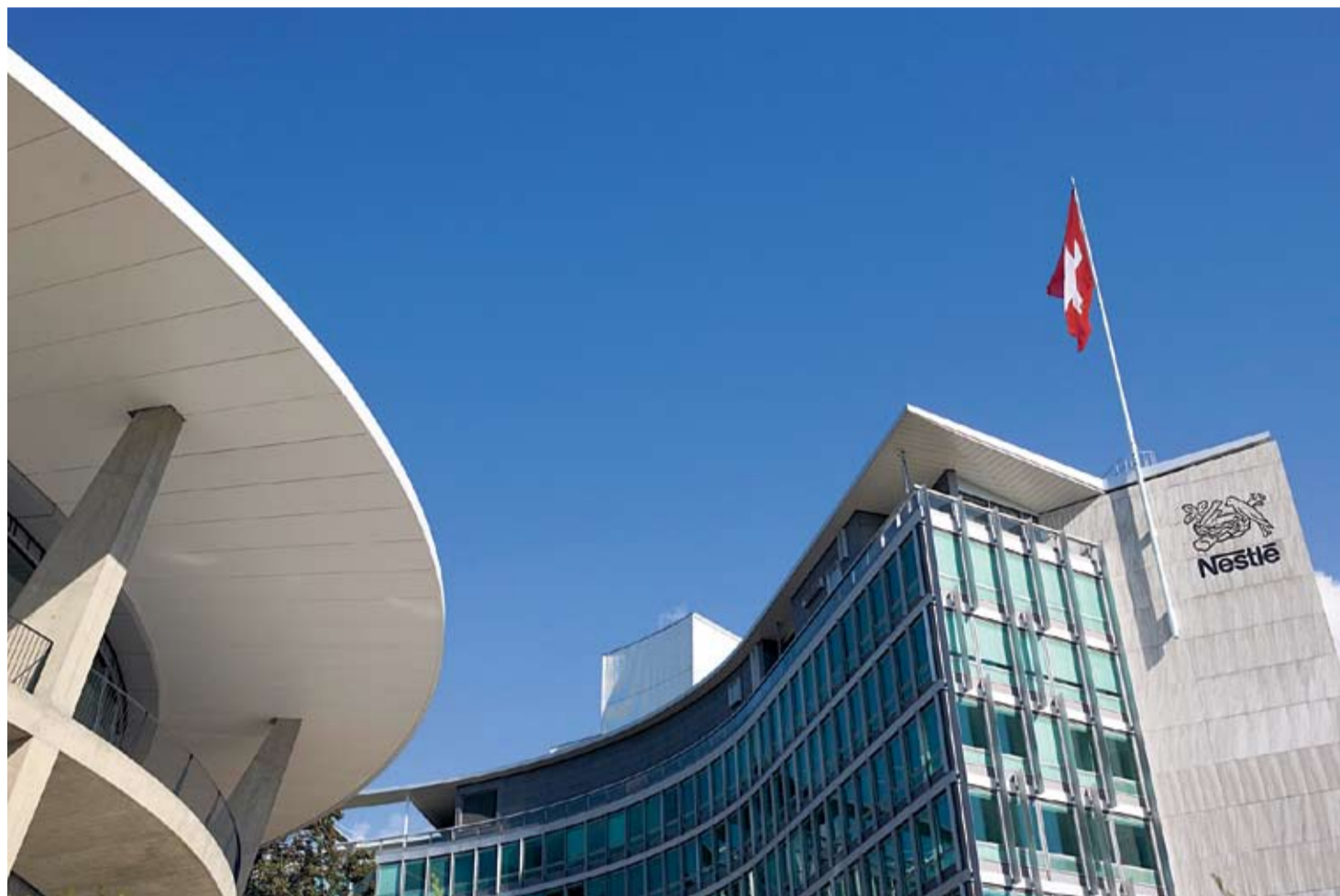
Fürchtet um den guten Ruf: Der Babymilch-Skandal in China droht die Reputation von Nestlé mit Sitz in Vevey (Bild) zu beschädigen.

Und obwohl Negativrankings von den Fachleuten als eher schwaches Tool gewertet werden, können auch solche von unbekanntem Organisationen den betroffenen Unternehmen gefährlich werden. Denn Rankings vereinfachen komplexe Sachverhalte. Wenn die Medien dies aufgreifen, droht ein beträchtlicher Reputationsschaden. Bei Nestlé beispielsweise hat es laut Missbach auf der ganzen Welt verteilt kleine Kampagnen bezüglich der Kommerzialisierung von Wasser, der Verlet-