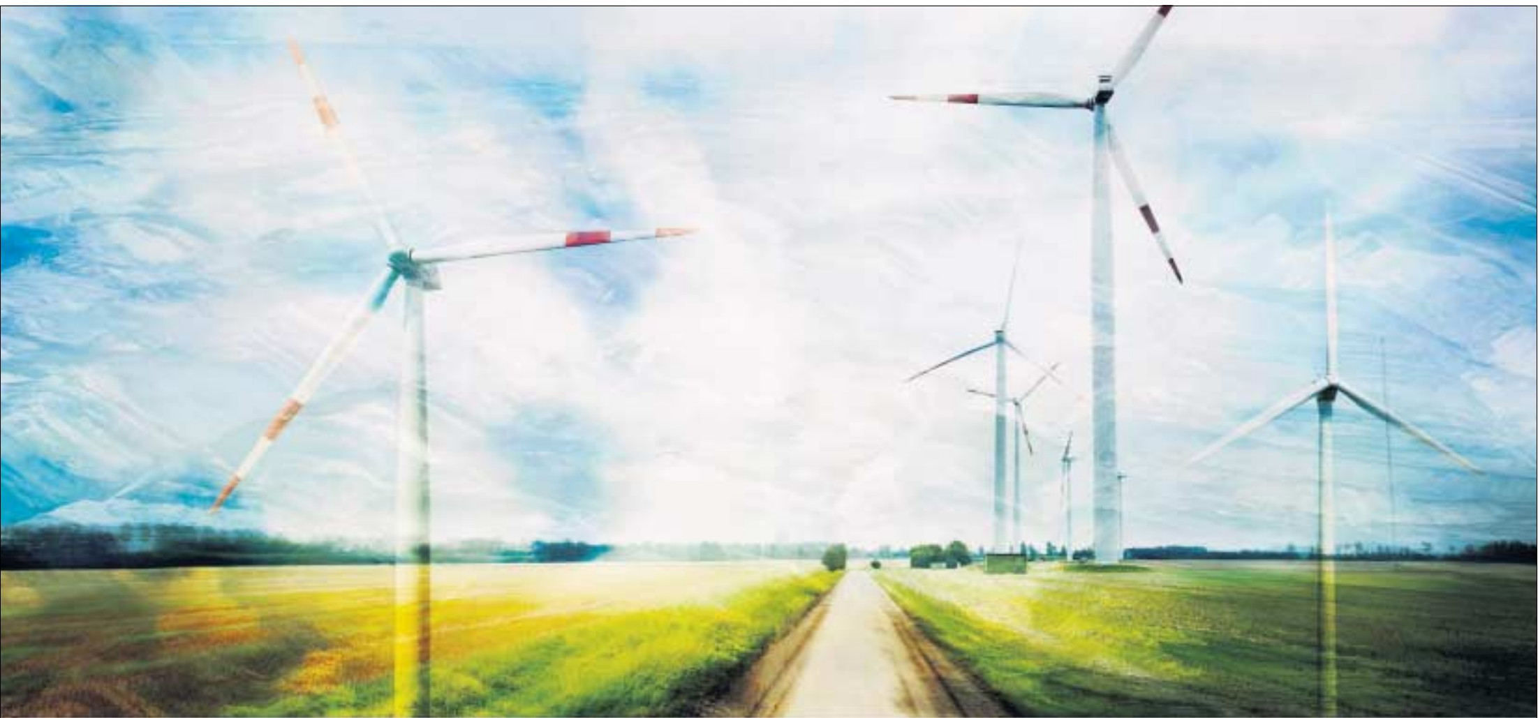
Wind ist eine saubere Energie. Strom gibt es aber nur dann, wenn der Wind auch bläst.