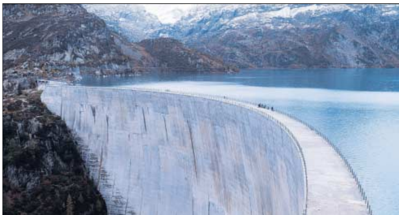
Die Schweiz produziert viel sauberen Strom aus Wasserkraft. Im Bild der Emosson-Staudamm im Kanton Wallis.

Punkto Auswahlverfahren werden neue Wege eingeschlagen. Im Regelfall hat der Anleger die Wahl zwischen Investitionen über den Best-in-Class-Ansatz, wobei nach ökologischen, sozialen und finanziellen Kriterien die «Besten» der jeweiligen Branche ausgewählt werden. Je nach Anlagephilo-