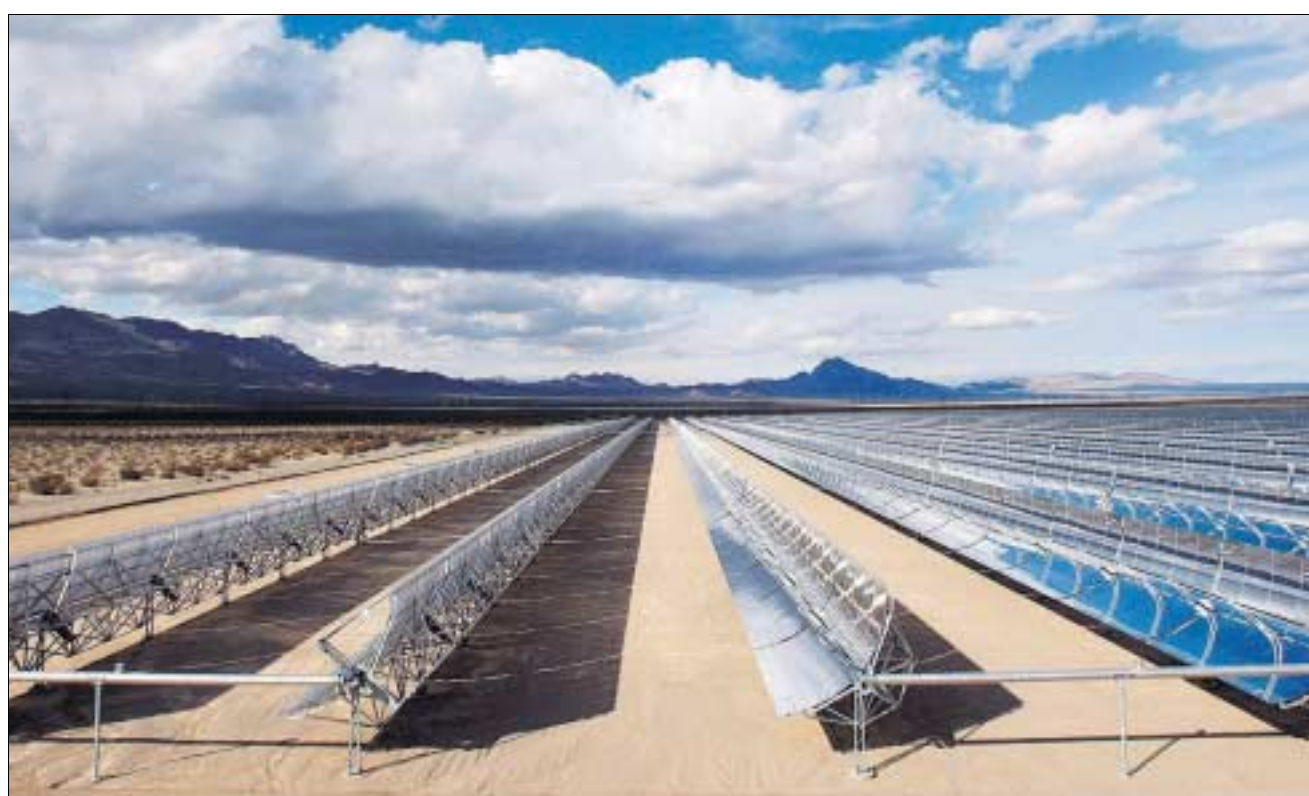
Ein solares Kraftwerk ausserhalb von Las Vegas in den USA. Sonnenenergie boomt und dürfte es weiter tun.